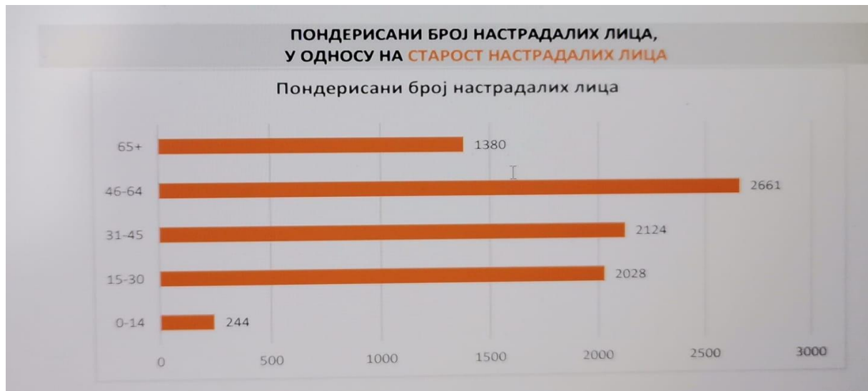
Grafikon 1. Ponderisani broj stradalih lica u odnosu na starost za period 2016-2020. godine ( 20210714104911-pancevo.pdf (abs.gov.rs) )